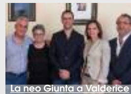
La neo Giunta a Valderice