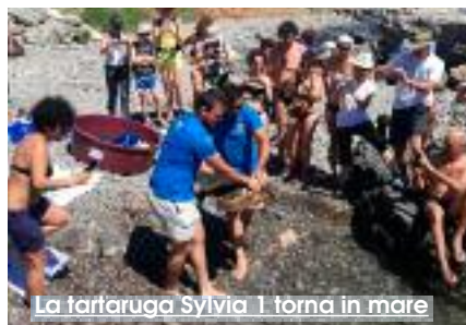
La tartaruga Sylvia I torna in mare

L'Area Marina Protetta e il Centro di Primo Soccorso per Tartarughe Marine di Favignana sabato scorso hanno celebrato il World Sea Turtle Day. Giornata dedicata alle tartarughe marine in memoria del Professor Archie Carr, nato il 16 giugno 1909 e appassionato a quest'ambito di studi e ricerche. L'AMP e il Centro di Primo Soccorso per Tartarughe Marine hanno aderito all'iniziativa organizzando attività ed eventi a tema, per porre l'attenzione sull'importanza della tutela del mare e della fruizione sostenibile per il benessere dei suoi abitanti. A Marettimo è stato rilasciato in mare, nelle acque in cui era stata recuperata da due diportisti, un esemplare femmina di Caretta caretta di 38 Kg. Durante il periodo di degenza al Centro di Primo Soccorso, la tartaruga ha defecato materiale plastico, inclusi tappi di bottiglia. L'esemplare è stato chiamato Sylvia, in onore della famosa oceanografa statunitense. A Favignana, invece, davanti alla sede del nuovo